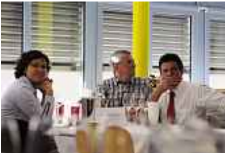
12 équipes de Suisse orientale se sont rencontrées à Samaden pour les «Régionales».

comme celles de l'examen des compétences de dégustation sont d'une importance cruciale à même échelle: «Pour la qualification, les deux disciplines exigent un bon nombre de points».