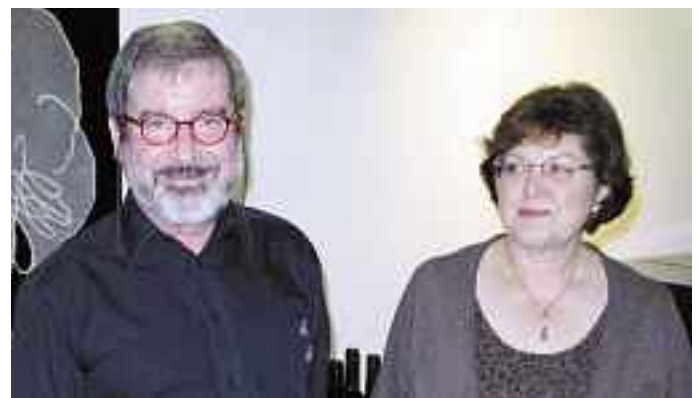
Die unermüdlichen Helfer hinter den «Kulissen».

Der Spitzenwein des Abends war aber der Domino del Cuco aus dem Ribera del Duero, der mit 34 Franken auch einem Preis-/Leistungsvergleich stand hält. Und der letzte Tempranillo, der Quinta de Portal aus dem Anbaugebiet Douro, vermochte namentlich die Freunde portugiesischer Tropfen zu begeistern. Für den Schreibenden wurde aber der kraftvolle Auftakt zuletzt von zu strengen Bitternoten übertroffen.