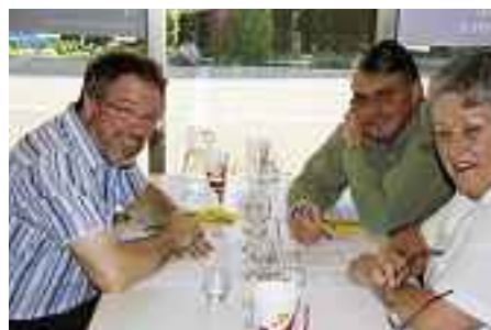
Otto squadre si sono presentate al via a Zofingen, nella sala Chi-Rho della chiesa cattolica.

François Murisier – che è d'altronde vicepresidente dell'Organizzazione internazionale della vite e del vino OIVV (!) – era molto compiaciuto del carattere amichevole del concorso, che non figurava solo come obiettivo «sulla carta» ma che lo si percepiva ovunque durante le selezioni regionali. Ciò gli sembra tanto più importante anche per il fatto che il concorso acquisirà in avvenire sempre più interesse in seno all'associazione: «Le squadre hanno dimostrato di essersi preparate accuratamente alla gara occupandosi con la massima serietà dei vari