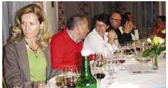
Im «Schweizerhof» war für die Weinfreunde bestens gesorgt.

Bei der anschliessend eigenverantwortlich vorgenommenen Be-