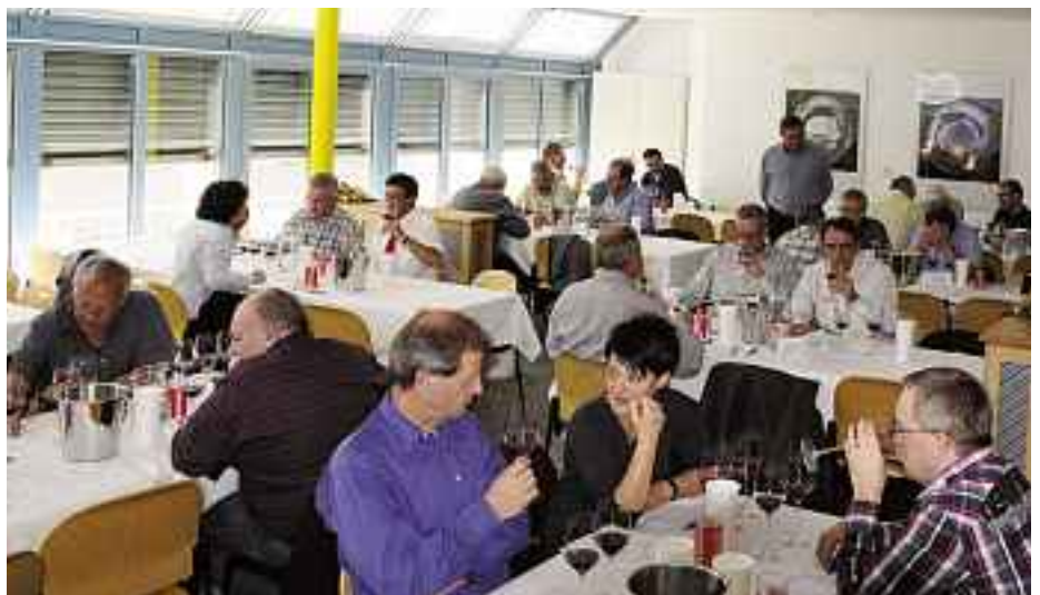
12 Teams kämpften in der Mensa der «Academia» von Samaden um eine Finalqualifikation.

Dass die Freude am Wein und der Spass an der Sache die entscheidenden Gründe für die Teilnahme sind, zeigte sich spätestens beim lockeren Apéro, der zum Abschluss des freundschaftlichen Wettstreits auf dem Dach der «Academia» kre-