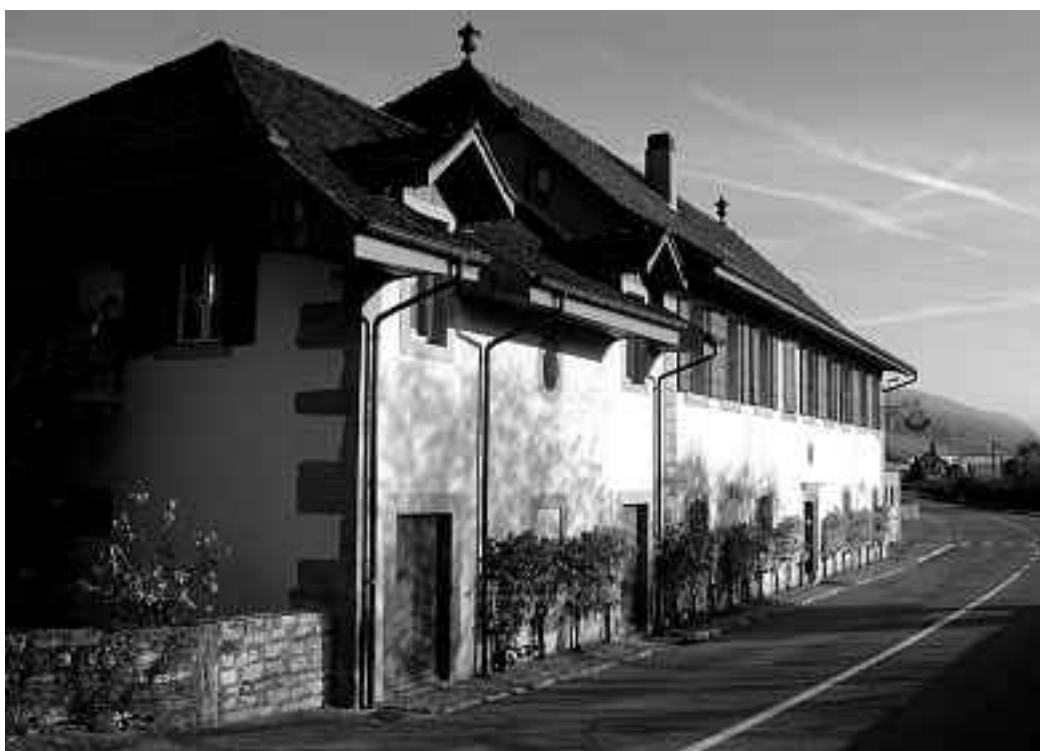
La cave du Domaine de l'Hôpital de Pourtalès à Cressier.

Enfin, le Pinot noir, avec sa robe rubis foncé brillant, il se caractérise au nez par des arômes de petits fruits rouges et noirs. En bouche: bonne fraîcheur et minéralité intéressante, bien soutenues par des tanins puissants, aptes à un bon vieillissement. Donc un vin à oublier deux ou trois ans à la cave!