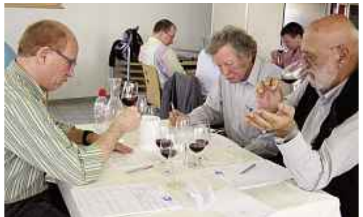
Sieben Equipen waren auf dem Weingut Fürst in Hornussen an der Arbeit.