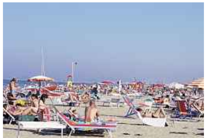
Rimini – auf diesen Sandböden wachsen keine Reben.

Organisatorisch war die Verkostung etwas anders aufgebaut als sonst: in jeder der vier Serien wurden ein Winzer, sein Anbaugebiet und drei Weine aus seiner Produktion (ein weisser und zwei rote) vorgestellt. Als Präsentato-