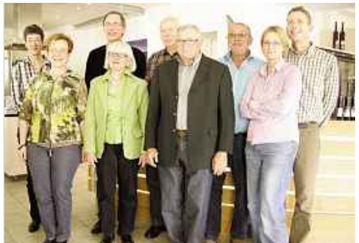
I tre squadre qualificati delle selezioni a Hornussen.