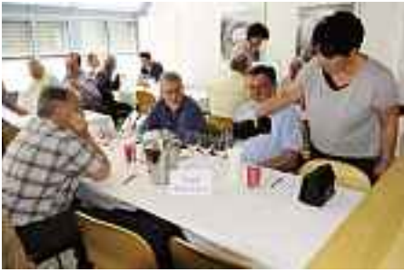
12 squadre della Svizzera orientale furono convocati alle selezioni regionali a Samaden.

ha fatto tutto il possibile affinché i 36 partecipanti potessero assolvere il non facile compito in condizioni ottimali e professionali, presso la mensa del Centro «Academia».