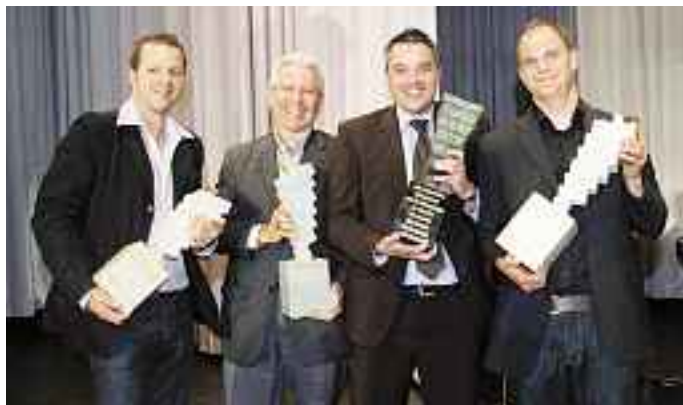
Die glücklichen Schweizer Sieger am Internationalen Gutedelcup 2011.