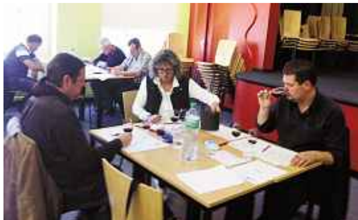
A Monthey, la section Haut-Lac a assuré une organisation parfaite.