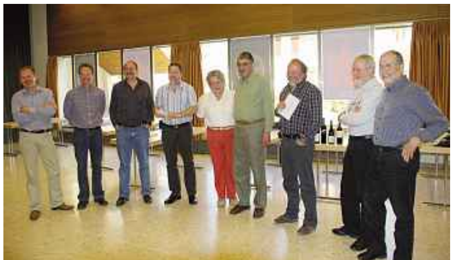
Les trois équipes qualifiées pour la finale lors des éliminatoires régionales à Zofingue.

Comme la passion pour le vin et le plaisir à participer sont les raisons principales des participants, on a bien sûr à l'issue de concours ami-