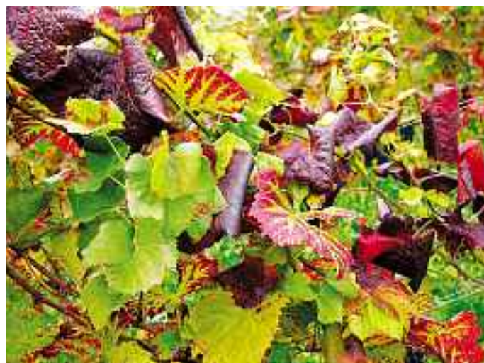
La dissémination de la flavescence dorée dans le vignoble est principalement le fait d'une transmission de cep à cep par la cicadelle Scaphoideus titanus Ball.

santiago.schaefer@acw.admin www.agroscope.ch