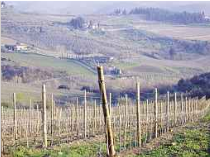
Rimini – unweit der bekannten Strände reift der Bianchetto.