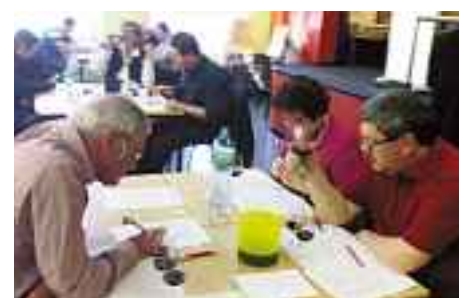
Conditions idéales dans les classes de l'Ecole de commerce de Monthey.

Comme le commentait le président de la section du lac de Thoune, Koni Burkhalter, l'événement fut dans son ensemble une parfaite réussite, ponctuée en plus par une excellente ambiance. C'est avec un léger regret tout de même qu'il aurait bien voulu voir toutes les sections bernoises au «départ». – Pour la finale à Soleure, les équipes suivantes se sont qualifiées à Thoune: «Thunersee 1», «Bern 2» et «Bern 3».