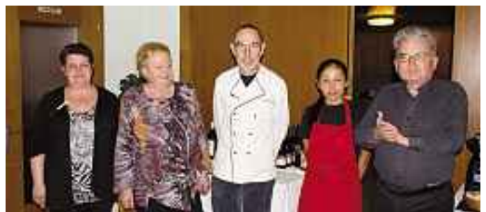
Das «Löwen»-Team sorgte für den perfekten Rahmen.

Tatsache ist, dass nur die wenigsten Weingeniesser auch wirkliche