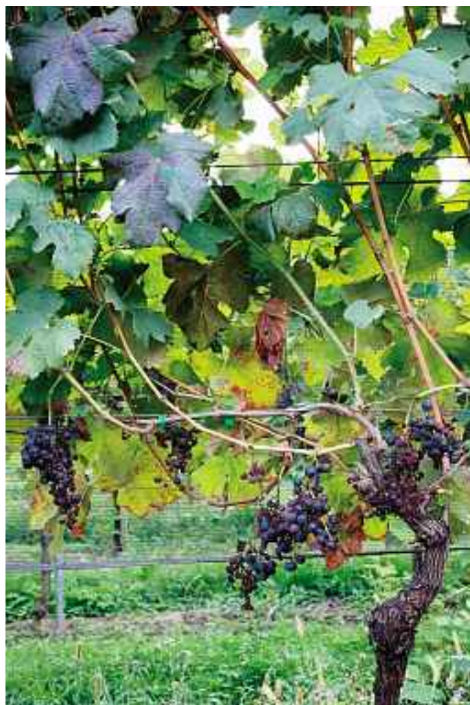
Goldgelbe Vergilbung beim Merlot.

Nachdem sich 2008/2009 die Lage im Sopraceneri beruhigt hatte (Bellinzonese 0, Locarnese sechs Fälle in 2009), spannte sich die Situation in 2010 wieder an: 25 befallene Rebstöcke im Bellinzonese und sieben im Locarnese. Ein bedeutender Herd wurde in der Gemeinde Camorino (Bellinzonese) erfasst. Die bekannten Herde der GGV werden im Kanton weiterhin genau überwacht: Acht positive Rebstöcke werden in Pedrinate (Ausgangspunkt der Krankheit), Sementina und Losone ausgerissen.