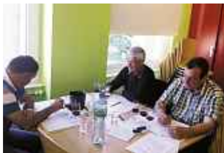
Neuf équipes se sont affrontées dans les classes de l'Ecole de commerce de Monthey.

cal savourer pleinement l'apéro organisé sur le toit de l'«Academia». Après avoir communiqué le classement, des discussions animées ont eu lieu au cours du délicieux repas. Quatre des douze équipes de Samedan se sont qualifiées pour la finale: «Thurgovie», «Engadine 1» ainsi que les deux équipes de la section de Weingilde Gallus «Team Rivaner» et «Team Pinot-Gallus».