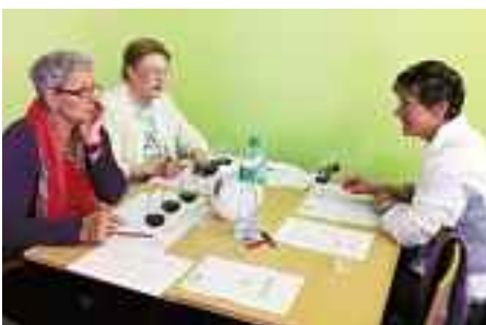
Monthey. On s'est réjoui du caractère amical de cette compétition.

A l'issue de ce concours, un «cadeau» a été offert aux participants: les trois premières équipes ont reçu chacune une bouteille de vin des vins dégustés. Toutes les équipes ont reçu un drop-stop de la «Confrérie St. Martin» et un petit paquet de mouchoirs de la ville de Zofingen. Ceci