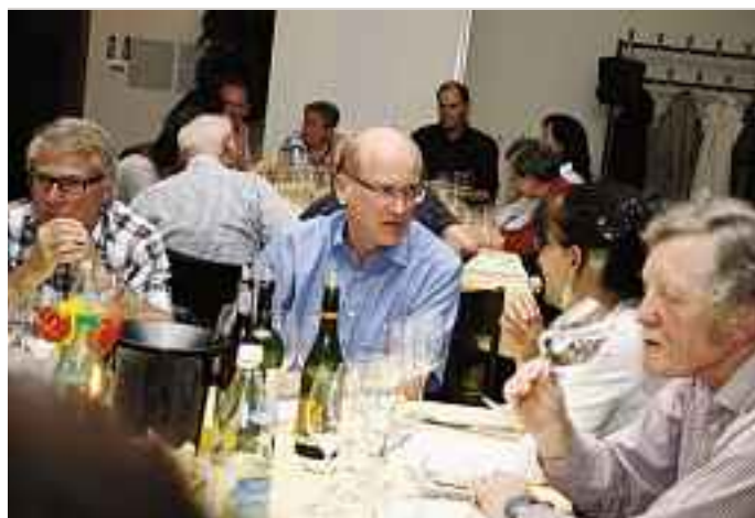
Weinfreunde beim Fachsimpeln.

Das Weingut Engelbrecht Els am Helderberg in Stellenbosch wurde 1999 gegründet. Seine Cuvée «Guardian Peak Frontier» 2007 präsentiert sich mit violetten Reflexen und duftet nach reifen Brombeeren. Sie wurde aus Cabernet Sauvignon (45%), Shiraz (42%) und Merlot (13%) – zur Verfeinerung – zusammengestellt.