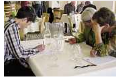
Les équipes du nord-ouest de la Suisse se sont rencontrées au domaine Fürst à Hornussen.

Les équipes à Balerna qui se sont qualifiées pour la finale sont «Dream Team» de la section