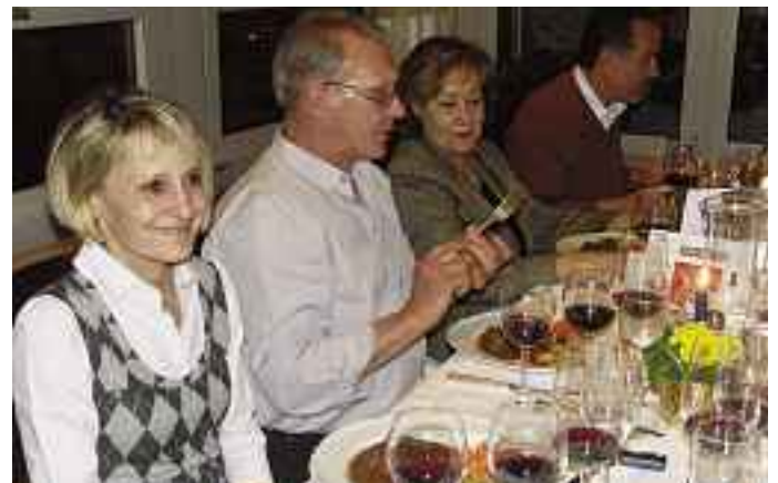
Glückliche und zufriedene Teilnehmer.

Nach dem schaumigen Auftakt wurde mit einem Filet von der Dorade auf Gemüsebett das Menu eröffnet. Im Glas funkelten bereits zwei weitere Weine: der Blanc 2009 der Domaine Château Barthes aus Le Beausset und der Rosé 2009 der Domaine Lafran-Veyrolles, in la Cadière d'Azur, der grössten Weinbaugemeinde des Bandol, gelegen. Der Weisswein wurde aus den für die Provence und das Bandol typi-