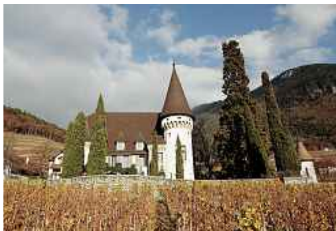
Château Maison Blanche, Yverne, une des membres les plus nobles de l'association Clos, Domaines & Châteaux.

Le contrôle des différents paramètres viticoles est assuré par la Commission technique qui s'assure par des visites régulières que les travaux à la vigne et les bonnes pratiques œnologiques sont respectés. Une dégustation finale