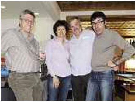
Dank ihnen lief in Samaden alles rund.

denzt wurde. – Nach Bekanntgabe der Rangliste liefen beim anschliessenden köstlichen Mittagessen die angeregten Diskussionen weiter.