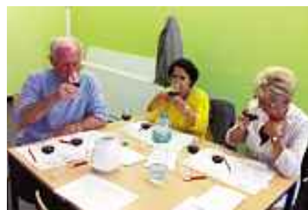
Un climat bon enfant, bien que les équipes ont mesuré leurs connaissances sérieusement.