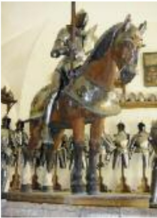
Die Rüstammer der Churburg.

sante Gebäudekomplex umfasst Bauelemente der romanischen und gotischen Zeit und einen bemalten Arkadengang aus Laaser Marmor aus der Renaissance. Die Rüstammer enthält sämtliche Rüstungen aus dem Familienbesitz und ist die grösste private, im Original erhaltene Waffenkammer der Welt.