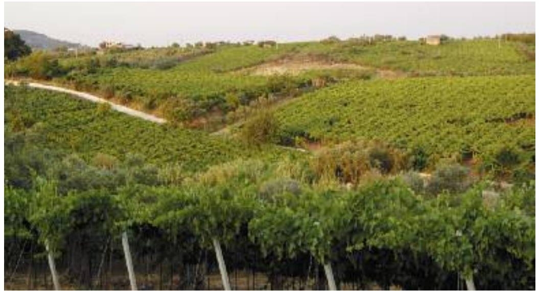
Die Falanghina wächst insbesondere auf den vulkanischen Hügeln von Kampanien unter idealen Bedingungen.

Grenache blanc wird hauptsächlich in Südfrankreich so-