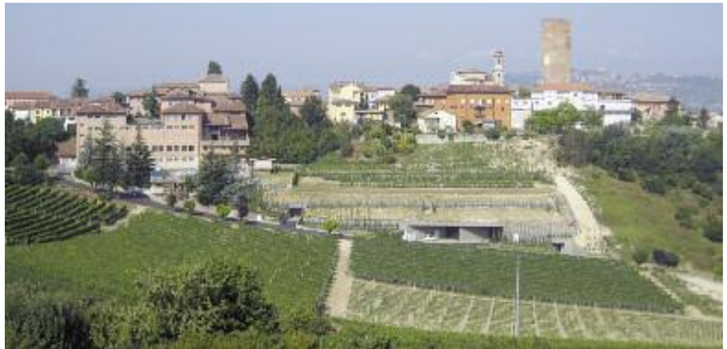
Blick auf das berühmte Städtchen Barbaresco.

Die Weinproben finden normalerweise im Saal des Restaurants Gersag, Gersag-Zentrum, in Emmenbrücke statt. Beginn ist jeweils um 19.30 Uhr. – Interessierte Personen sind an einer gratis Schnupper-Weinprobe herzlich willkommen.