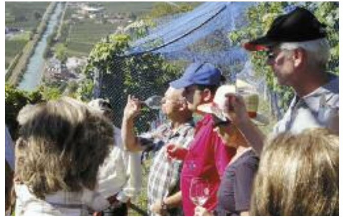
Blick ins Obst- und Rebtal vom Juvaler Hügel aus.