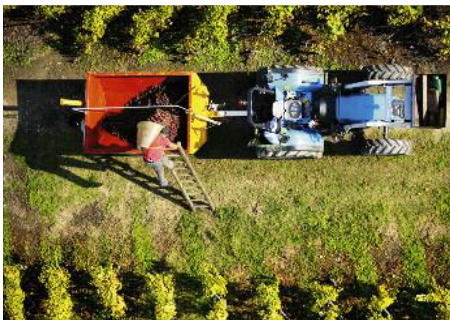
Ernte in den Genfer Rebbergen.

Dafür, dass insgesamt genügend Westschweizer Weine verfügbar sein sollten sprechen auch die in der Waadt und im Kanton Genf geernteten Mengen. An weissen Gewächsen wurden in der Waadt 20,7 Millionen Liter eingekellert, an roten rund 8 Millionen Liter, was weitgehend dem Konsum von 2009 entspricht. Zudem sind die Vorräte an Waadtländer Gewächsen nicht unbedeutend. Und die rund 10,3 Millionen Liter Genfer Weine des Jahrgangs 2010 übersteigen die im 2009 abgesetzten Mengen. (Zu berücksichtigen ist übrigens bei einem Vergleich mit dem Vorjahr, dass in den Genfer Zahlen von 2009 die Ernte aus den 132 Hektaren Rebland der französischen Grenzzone nicht enthalten waren. 2010 sind sie die gut 9'000 hl Wein wieder in der Gesamtmenge des Kantons Genf in-