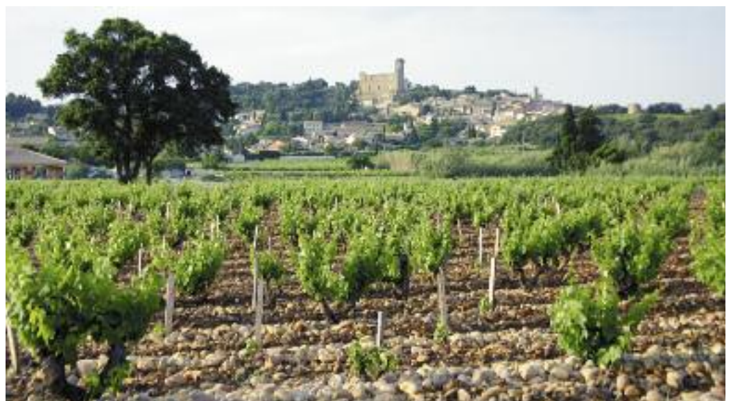
Blick über die Reben auf Châteauneuf du Pape.

In intensivem Rubinrot mit Violetreflexen präsentierte sich der «Le Pic des Combettes» 2007, ein Cuvée aus Grenache (60%), Syrah (20%) und Mourvèdre (20%) der Appellation Côtes du Rhône Villages Contrôlée von Tobler Père et Fils in Uchaux. Nach der Kaltmazeration während neun Tagen folgte der Gärungsprozess unter kontrollierten Temperaturen. Die Mikrooxidation, d.h. die feindosierte «Injektion» von Sauerstoff während 25 Tagen, half die Tannine zu verfeinern. Der Ausbau erfolgte in Allier-Eichenfässern während mindestens 24 Monaten. – In der Nase dominieren Aromen roter Beeren sowie Weichselkir-