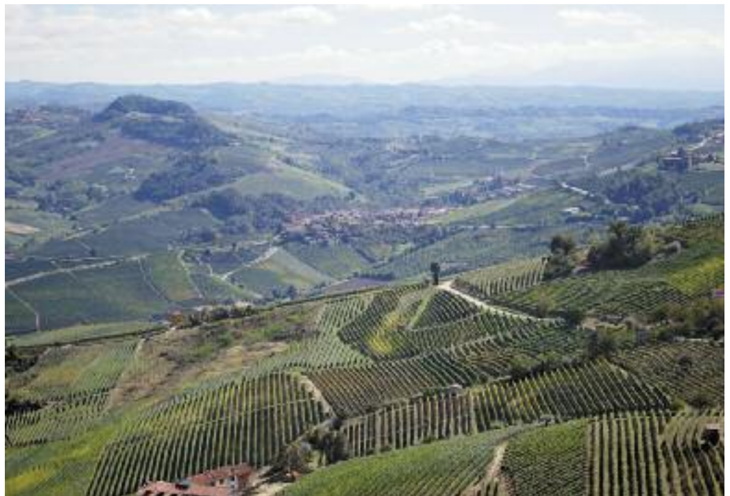
Blick von La Morra über die Reben des Barolo-Anbaugebiets.

Degustationsnotizen zur zweiten Serie: Der erste und der dritte Wein der Serie stammen von Parzellen, die gleich nebeneinander liegen. Jene des ersten ist aber nicht mehr im Kataster, weshalb