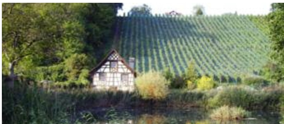
Reben der Karthause Ittingen.

Zu Engpässen könnten die kleinen Erntemengen in der Drei-Seen-Region führen. Insbesondere einige Neuenburger Spezialitäten dürften bald fehlen. Die hohe Qualität muss hier über die vor allem infolge Wassermangels extrem reduzierten Erträge hinweg trösten. Mit 3,1 Millionen Litern wurde zwischen Vaumarcus und Le Landeron immerhin um 15 Prozent weniger geerntet als im 2009! Andererseits ist der Umfang der Lagerbestände an kuranten Kreszenzen nicht zu unterschätzen.