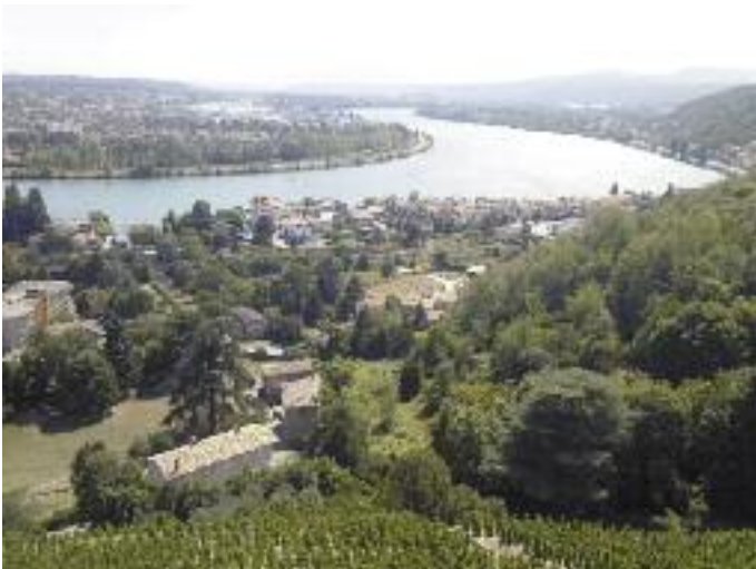
Blick aus den Reben auf das Städtchen Condrieu und die Rhone.

schen mit feinwürzigen Noten von Thymian und Rosmarin.