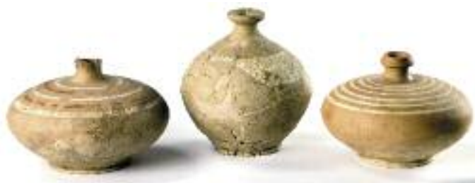
Kreiselvasen aus Sembrancher. 2. Jh. v. Chr.

Nach dem 5. Jahrhundert verlieren sich die Spuren. Die Zeit der Merowinger, der Franken und Karolinger ist – nicht nur die Geschichte des Wallis macht darin keine Ausnahme – arm an greifbaren Zeugnissen und bleibt im Dunkeln.