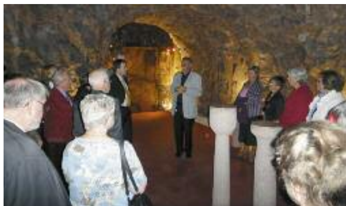
Im Felsenkeller des Landesweinguts Laimburg.

Dort ist die Lagerung bei einer natürlich-konstanten Raumtemperatur sichergestellt. Zusätzlich wurde auch ein 300 m 2 grosser Raum aus dem Felsen gesprengt, welcher der Südtiroler Landesregierung als Repräsentationsraum dient. Im imposanten Felsenkeller sind die Schweizer Gäste musikalisch mit Wiener Walzer begrüsst worden. Der Direktor erläuterte mit blumigen Worten die zwei Weinlinien, die das Landesweingut führt, die Gutsweine und die Burgselektion. – Die mitreissende musikalische Begleitung des Damensalonorchesters «La Valse», die auch den kulinarischen Teil umrahmte, begeisterte die ganze Gesellschaft.