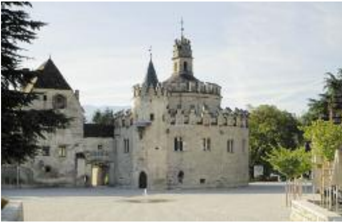
Der imposante Bau des Klosters Neustift.