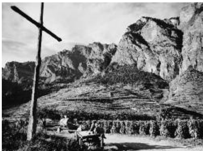
Ernte in Chamoson vor dem Zweiten Weltkrieg.

Zum Druck durch Parasiten und Pilzkrankheiten kommt in den Jahren 1917 und 1918 eine Weinschwemme, nehmen in den