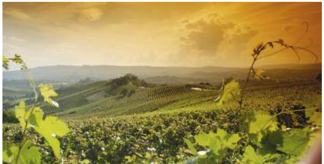
Glücklich, wer im Piemont noch Weine der Sorte Nascetta findet.

Die Rebsorte Mencia wird in Nordwestspanien, in Galicien und