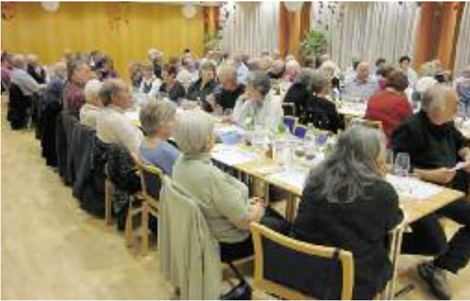
Die interessierten Schaffhauser Weinfreunde im Saal des Bistro «La Résidence» in Schaffhausen.

beeinflusst – auch bei uns spürbar, was die Tabelle von langjährigen Temperaturen von 1961 – 2009 eindrücklich bewies. Damit werden auch die Intervalle von Spitzenresultaten immer kürzer; der Jahrgang 2009 kommt dabei demjenigen von 2003 sehr nahe!