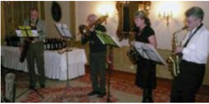
Nicht nur im Degustieren und Geniessen Meister: Geburtstagsständchen des Weinfreunde-Quartetts.