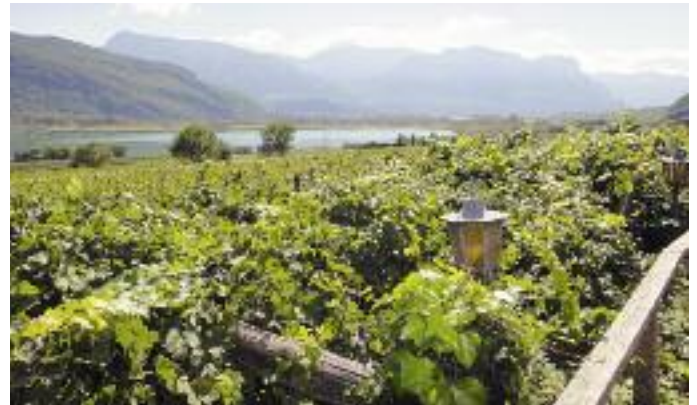
Vom Restaurant Seehofkeller aus genoss man den Blick auf die Reben am Kalterersee.