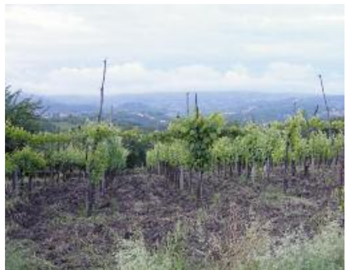
Im trockenen Klima Kalabriens gedeiht die Sorte Gaglioppo hervorragend.

Aus der weissen Rebsorte Vermentino, die ihren Ursprung vermutlich in Spanien oder Madeira hat, keltert die Azienda Malvirà im Pie-