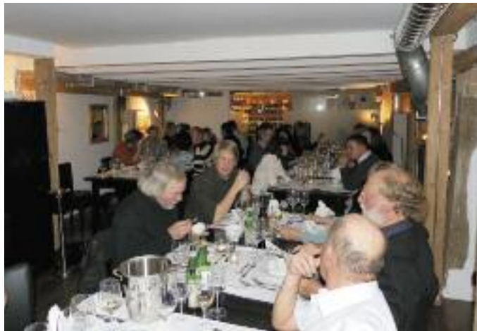
Hochgenuss in perfektem Ambiente.

Wir starteten mit einem mild gepfefferten Lachs, Avocado, herblichem Salat und einem leichten Safran-Pastis Espuma, begleitet von einem überraschenden Weisswein aus Süditalien, einem Grillo aus Sizilien. Für den zweiten Gang reisten wir kulinarisch nach Südfrankreich, wo wir zu einem Corbieres AOC Château la Babiste