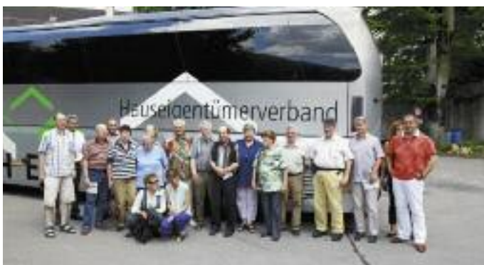
Die bestens chauffierte Reisegruppe.

Den etwas «happigen» Abschluss für eine Vormittags-Degustation bildeten der Himbeergeist und der Marc «Princesse» (dreifach gebrannt). Zu den ganz grossen Spezialitäten des Hauses gehören auch die zahlreichen Aroma-Essige. Grosse Einkäufe wurden jedoch auf Schloss Salenegg nicht getätigt, mehrheitlich