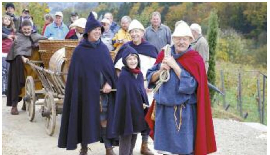
Mit einem Karren wurden die Trauben von Remigen nach Brugg transportiert.

Eine Wirtschaft mit römischem Essen im Angebot, geliefert vom Restaurant «Sternen», Oberbözberg, und ein Lagerfeuer belebten den Anlass, zu dem die ganze Bevölkerung eingeladen war. Ein Fest wurde gefeiert, das die Weinkultur im Zeichen des Wahlspruchs des römischen Gelehrten Plinius des Älteren, «In vino veritas» - im Wein liegt die Wahrheit – wieder aufleben liess.