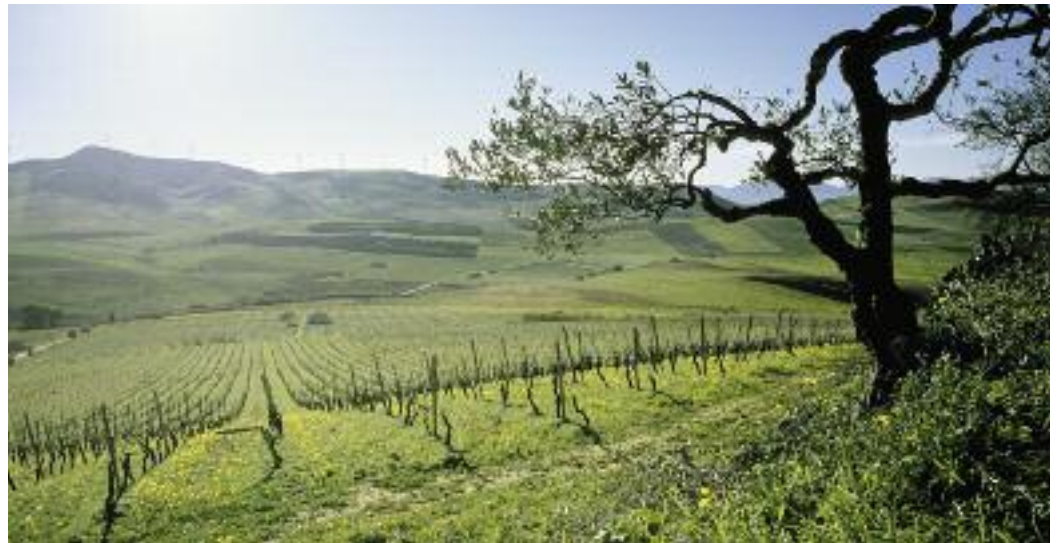
Reben in der Region Alcamo, westlich von Palermo.

Der «Lithos», ebenfalls ein reinsortig ausgebauter Nero d'Avola (und wie seine beiden Vorgänger aus der Provinz Marsala) von der Cantina Vinci steht mit seinem intensiven und langanhaltenden Duft den vorangegangenen beiden Weinen in nichts nach.