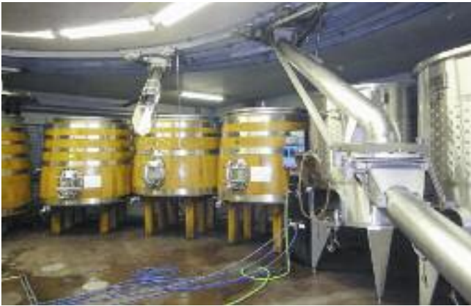
Im Keller von Manincor wird mir Schwerkraft gearbeitet.

wärme deckt 80% der Energie ab, 20% die Heizung mit Holzschnitzel.